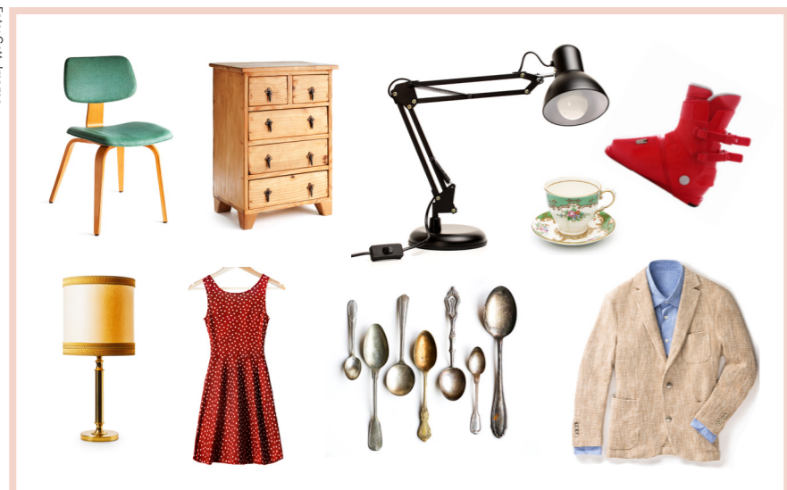
Noens skrot kan være andres skatter!