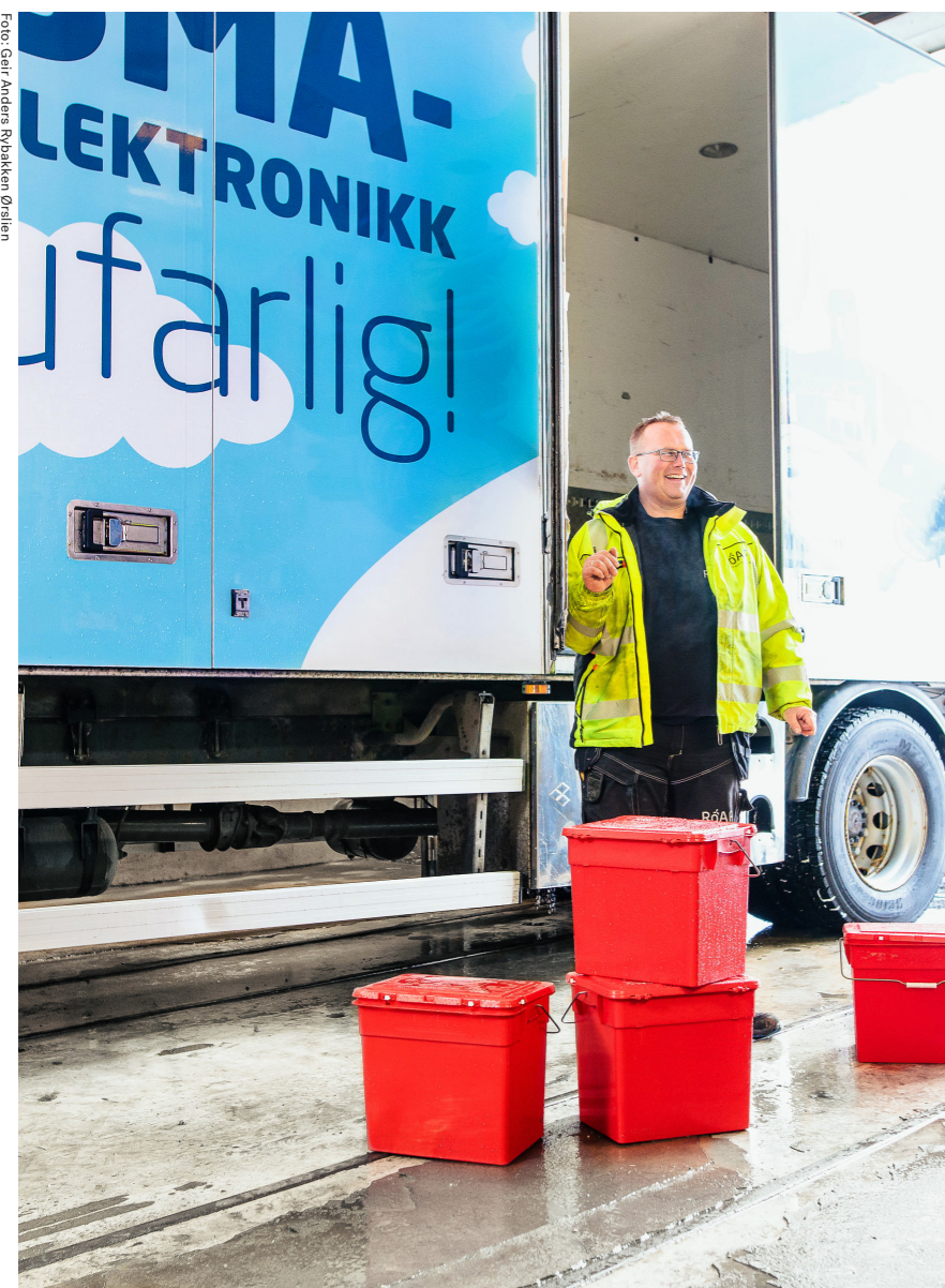
Miljøbilen henter farlig avfall og småelektronikk i nærområdet der du bor.

Mange av oss har farlig avfall og ødelagt småelektronikk liggende hjemme. En kortsluttet lampe, et gammelt malingspann eller en ødelagt skjoteledning. Ting man rett og slett ikke har fått summet seg til å levere til rett sted ennå. Da er det fint at ROAF sin Miljøbil kommer til ditt nabolag! Til den kan du levere farlig avfall og små elektriske og elektroniske produkter – gratis!