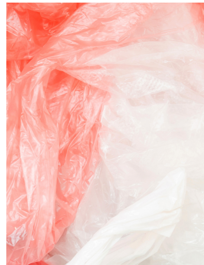
Ettersorteringsanlegget på ROAF Miljøpark er det første anlegget i verden som sorterer platen for deg.

ROAF selger platen til plastindustrien, som igjen bruker platen til å lage fleeceplagg, hagemøbler, plastsekker, blomsterpotter og mye mer. Det fine med plast er at de fleste plasttypene kan brukes mange ganger. Ved å gjenvinne en kilo plast, sparer vi hele to kilo olje!