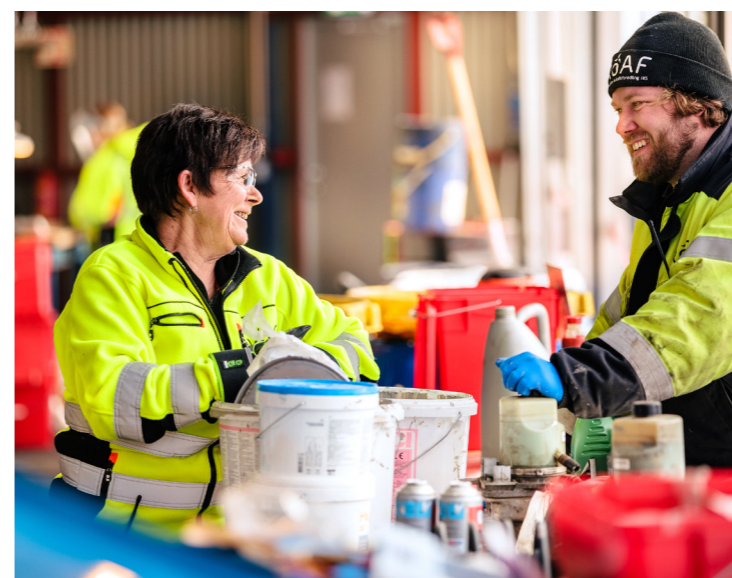
Mange av fagarbeiderne på ROAF har fagbrev og er eksperter på sitt felt.

livsfarlig: En gang kom det en traktor med en henger full av trevirke. Men, føreren hadde glemt å lukke luka bak! Det viste seg at han hadde mistet plank med spiker hele veien til Skedsmo. Da ble det litt oppstuss, men ingen kom til skade, heldigvis.